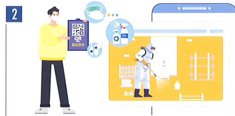
방역활동 작성(간단한 내용, 사진)

자세한 사항은 체육시설알리미( www.spoinfo.or.kr )를 확인바랍니다.